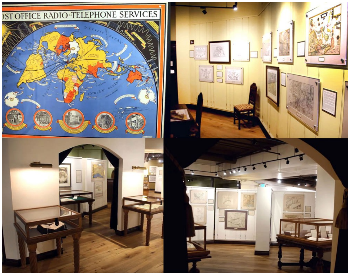
В музее Атласа в Ла-Хойе

Тут ролик, где можно более подробно посмотреть о музее -https://www.youtube.com/watch?v=UBc19nfwfal&feature=youtu.be