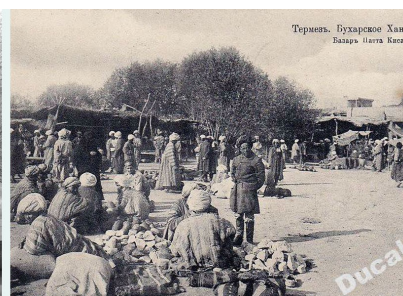
* старое фото о городе