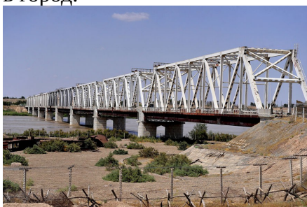
*через этот мост мы въезжали в Афганистан *будни

После того, как я отлежал около месяца в госпитале г.Термеза, и когда мне до «дембеля» оставалось 2-3 месяца - я попал служить в Гарнизонную Термезскую крепость. И - некоторое время безвылазно находился в ней. Правда, один раз выходил в «увольнительную» в город.