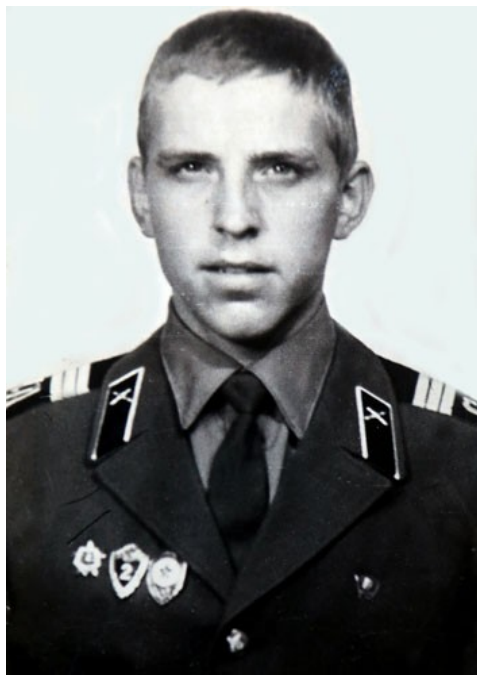
Фото из моего дембельского фотоальбома