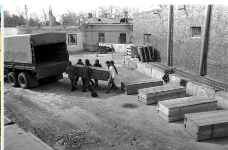
*груз-200 в Термезе (видел такое)