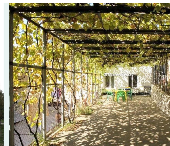
*виноградники в частном доме