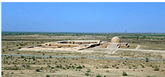
* древняя часть города