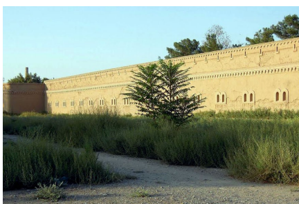
* так выглядит русская Крепость

Я попал служить в гарнизонную Термезскую крепость в 1980 г. , которая была построена русскими солдатами в 19 веке.