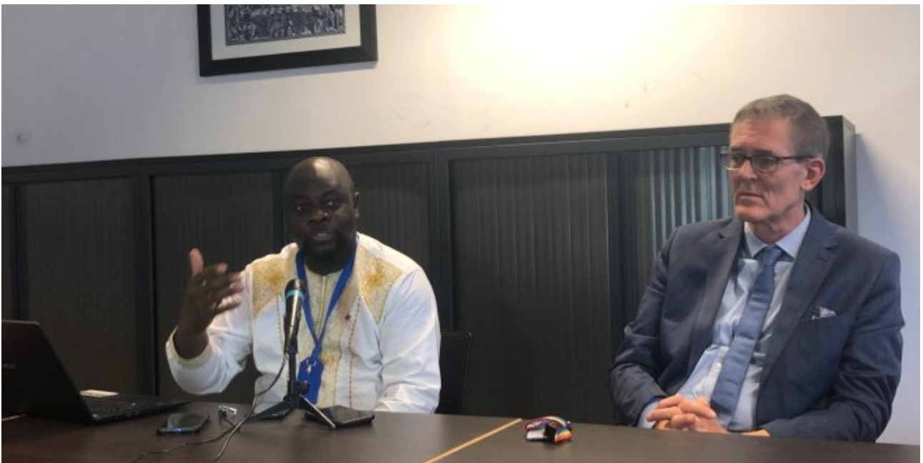
Посольство королевства в Конго