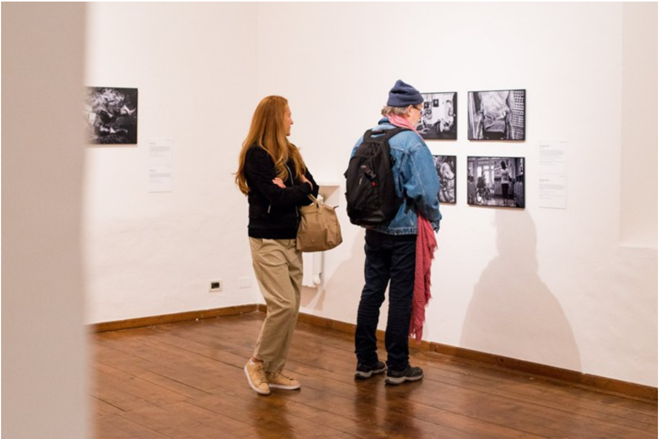
PAC Padiglione d'Arte Contemporanea