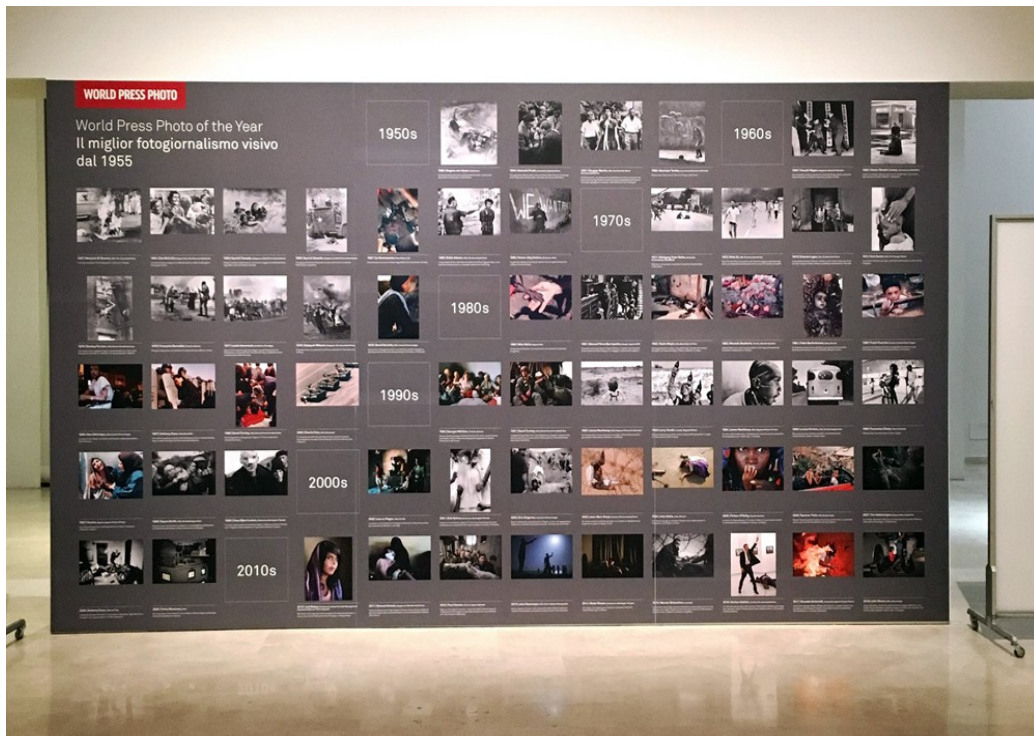
PAC Padiglione d'Arte Contemporanea