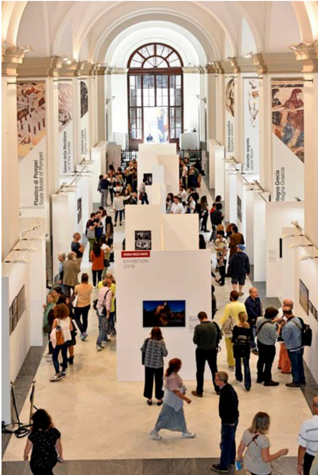
MANN - Museo Archeologico Nazionale