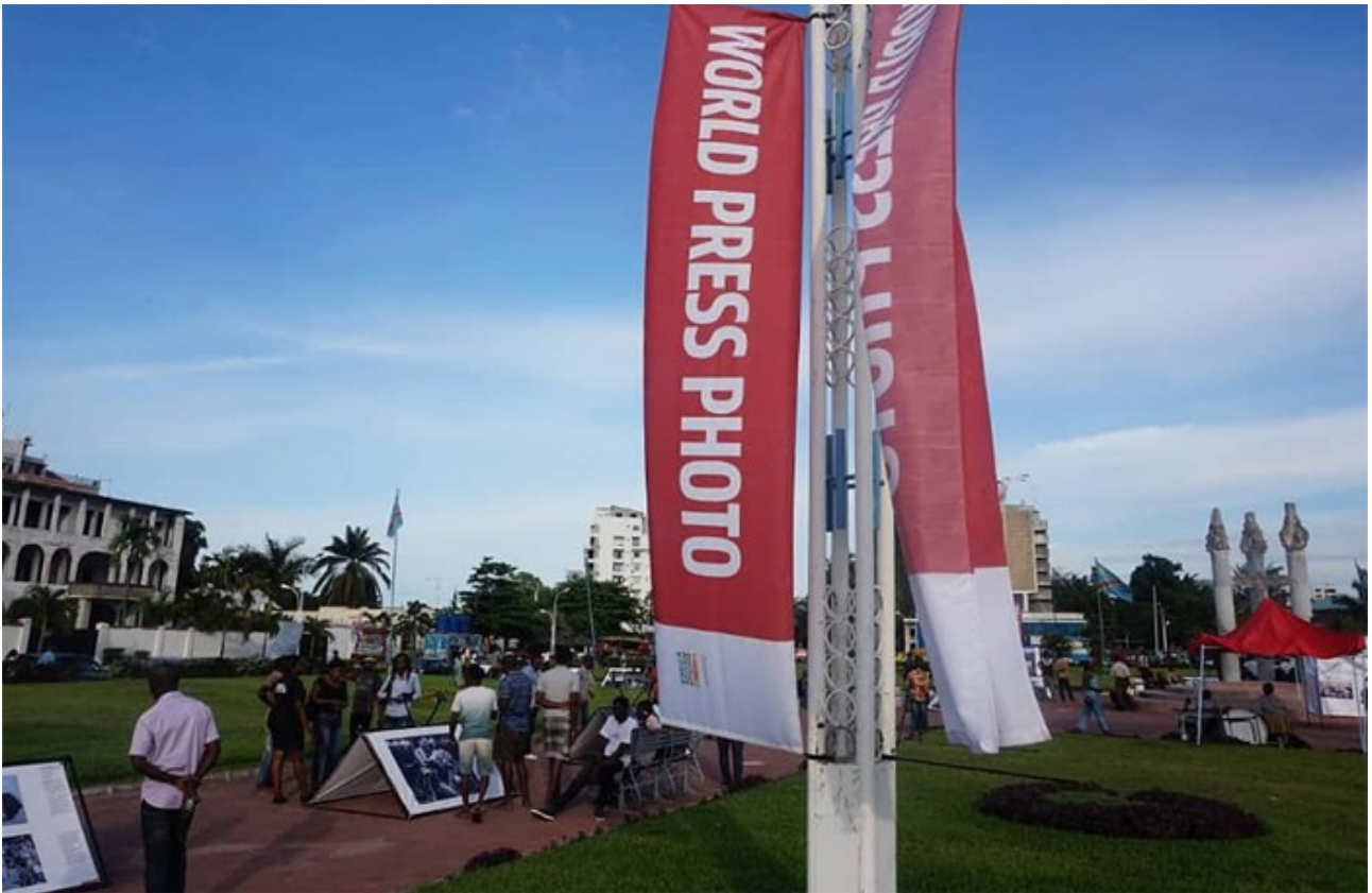
Посольство королевства в Конго