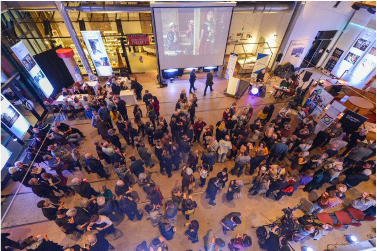
La Pulperie de Chicoutimi / Regional Museum