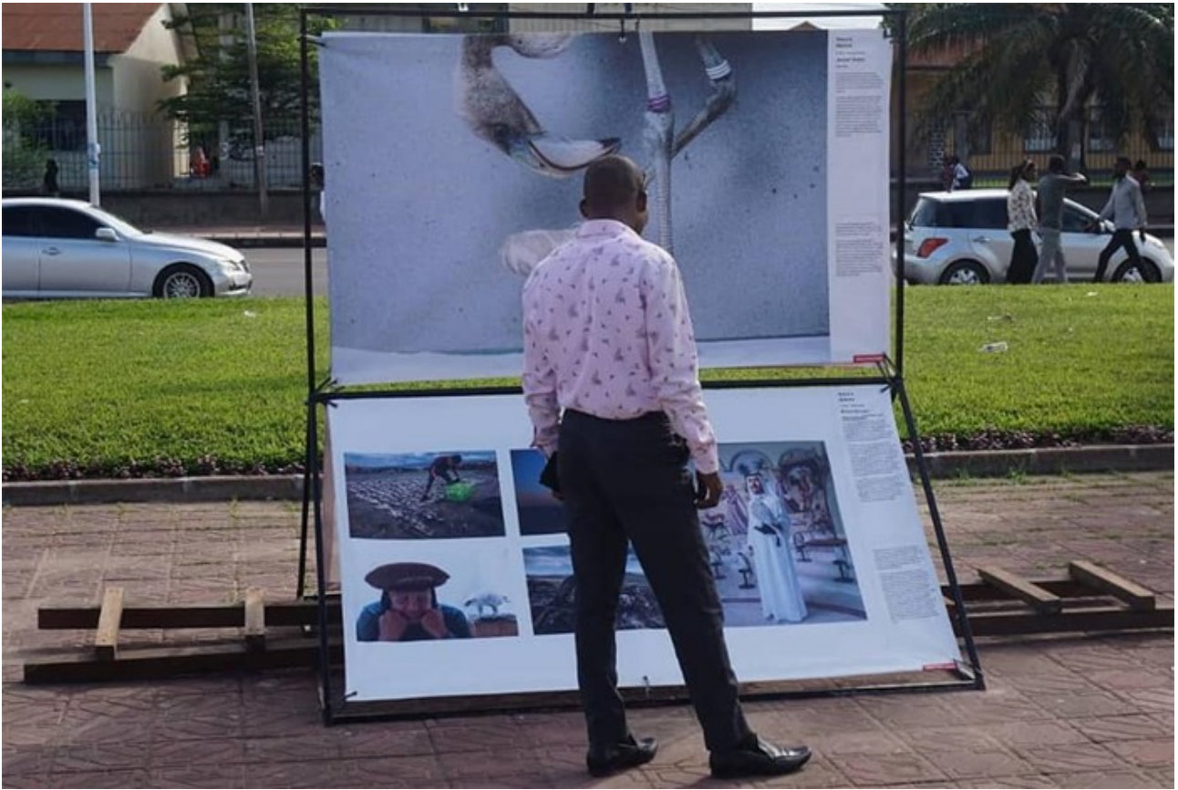
Посольство королевства в Конго