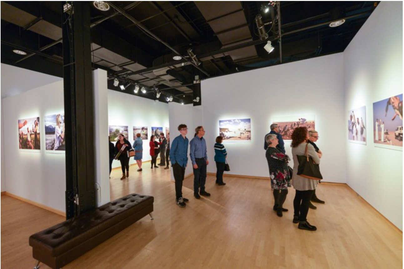
La Pulperie de Chicoutimi / Regional Museum