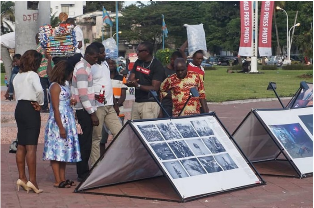
Посольство королевства в Конго