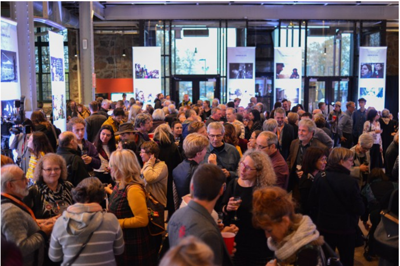
La Pulperie de Chicoutimi / Regional Museum