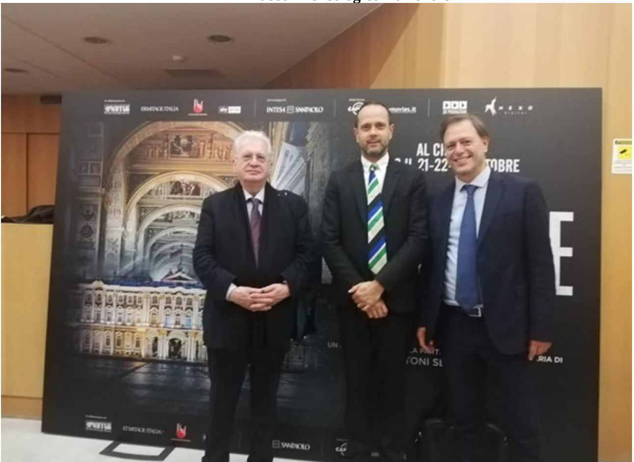
MANN - Museo Archeologico Nazionale