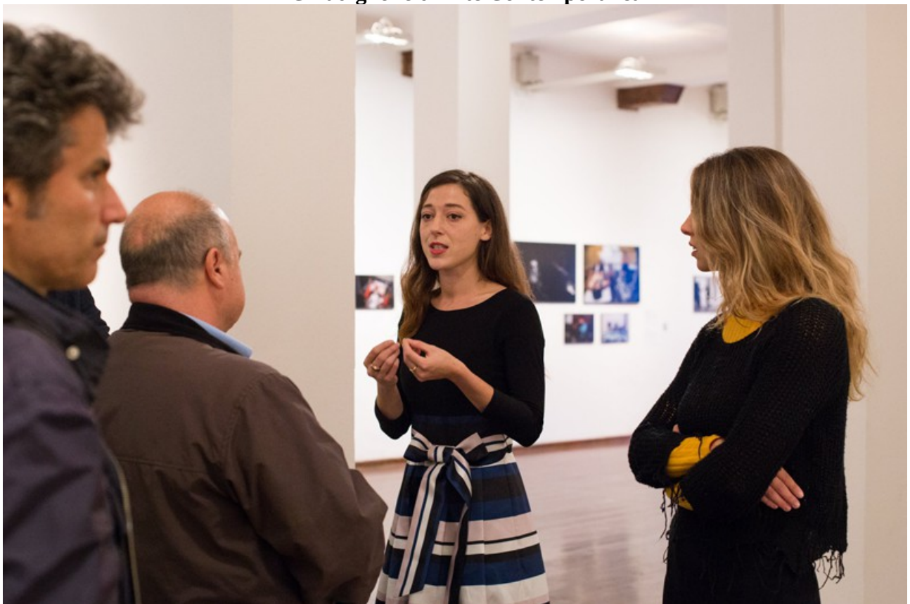
PAC Padiglione d'Arte Contemporanea