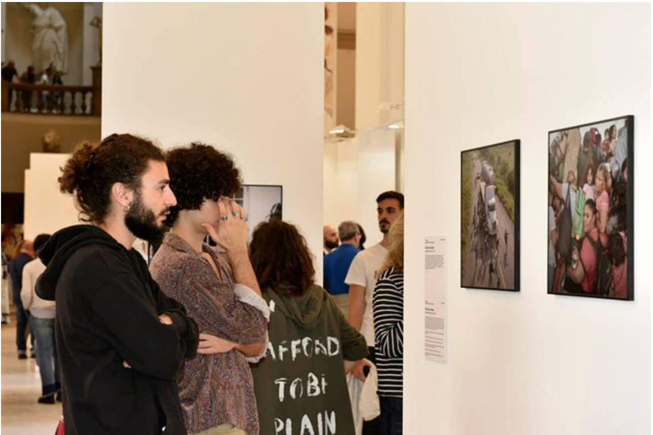
MANN - Museo Archeologico Nazionale