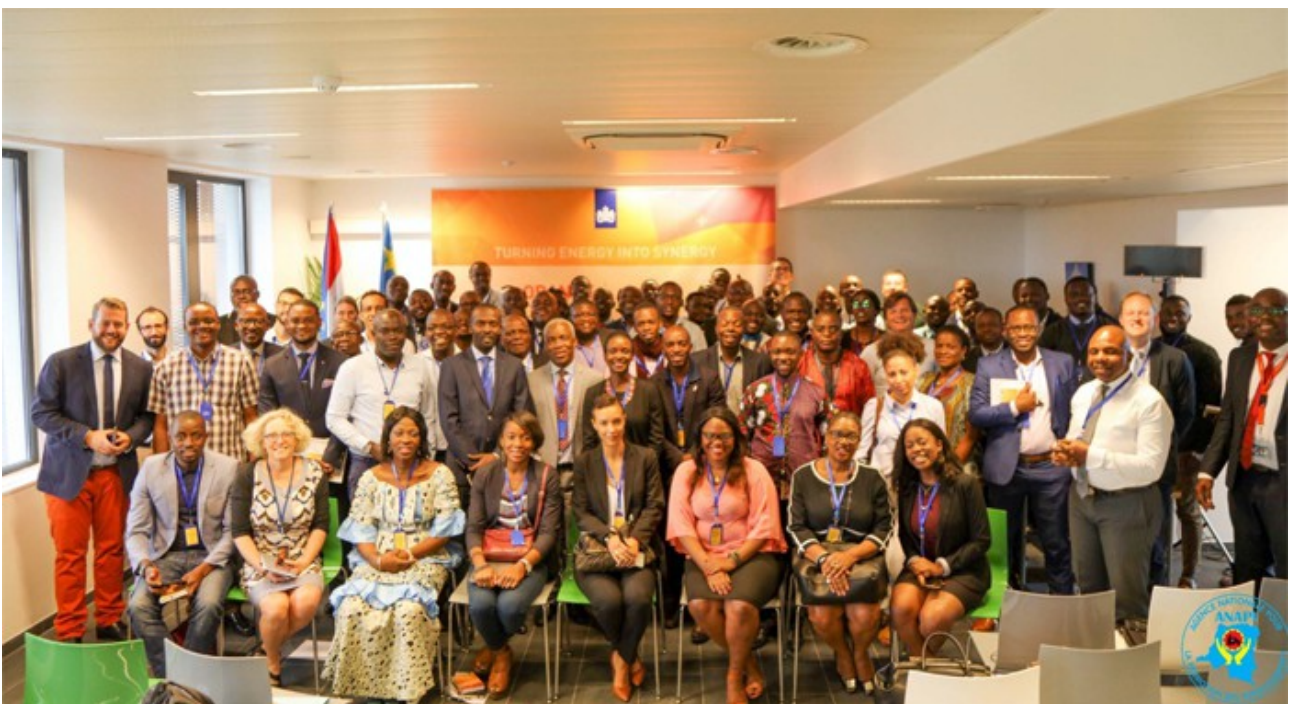
Посольство королевства в Конго