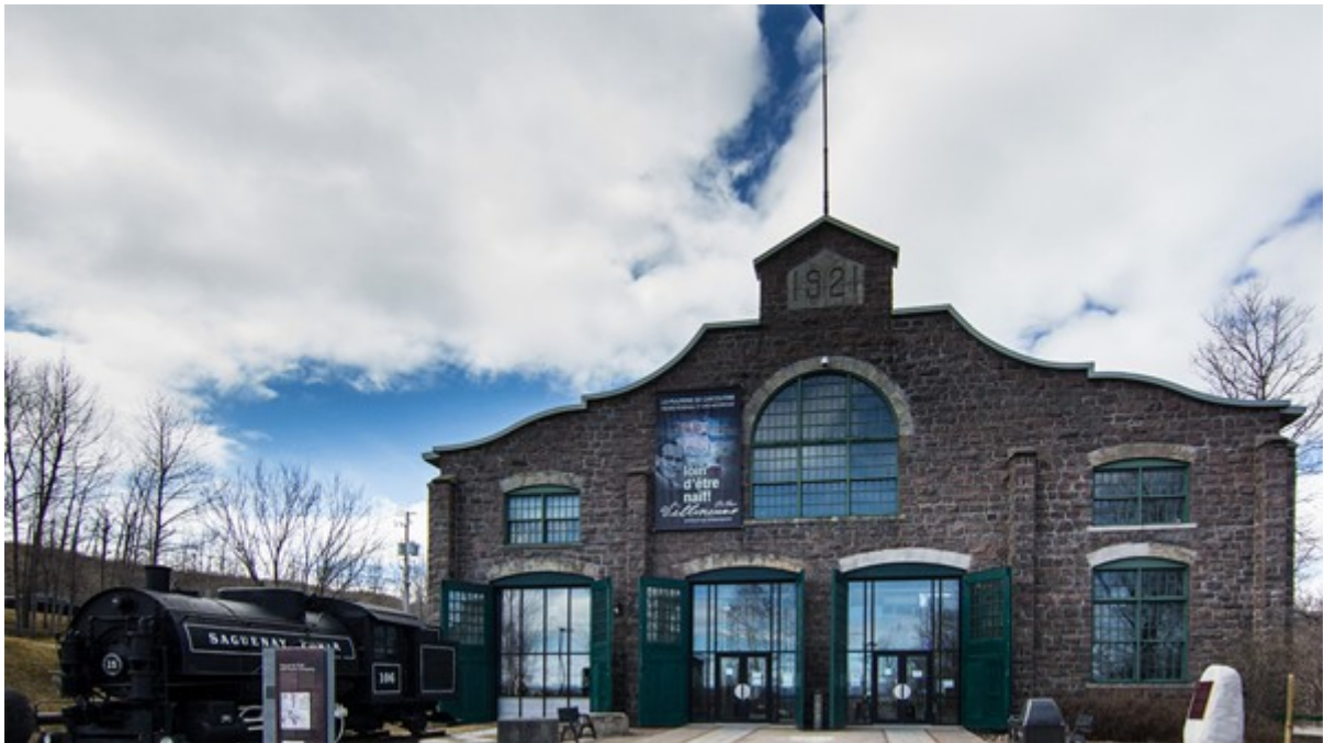
La Pulperie de Chicoutimi / Regional Museum