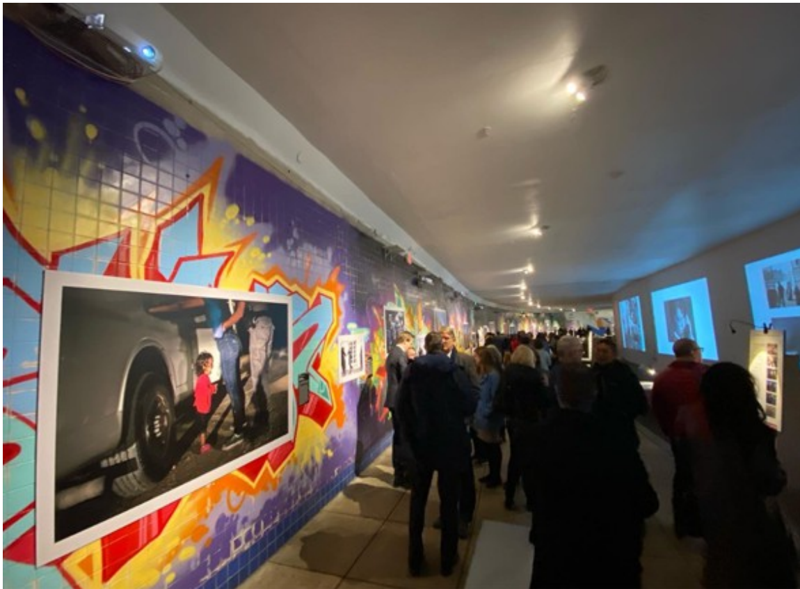
Dupont Underground, Washington DC, USA