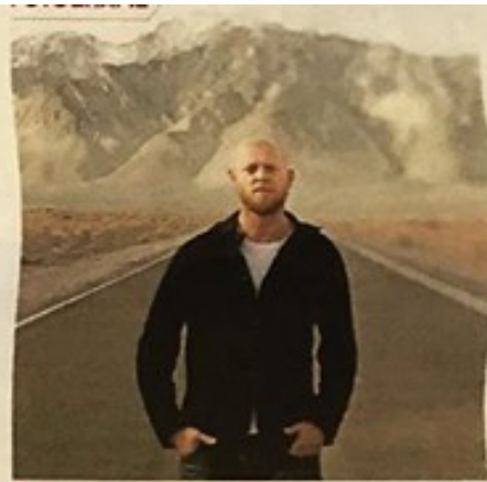
▲ Fotograaf Pieter ten Hoopen. FOTO: PIETER TEN HOOPEN

mij was het geen verrassing dat Trump tot president werd gekozen. Dat zat er aan te komen.“ De Tukker poogt met zijn fotoserie over vluchtelingen de thematiek van migratie een andere inwerking te geven. „Hoe we omgaan met de vluchtelingen-crisis is bedroevend. Ik vind het echt een schandvlek, we hebben een verantwoordelijkheid daarin. Door klimaatverandering en oorlogen raken bevolkingsgroepen ontheemd. Het probleem zal steeds groter worden en we moeten er oplossingen voor vinden.“