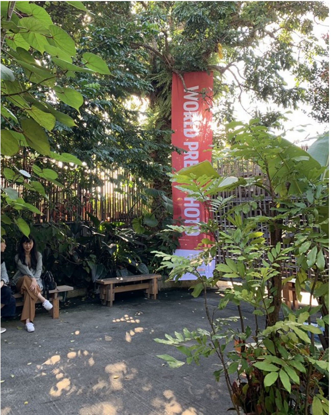
Тайланд Студия 94