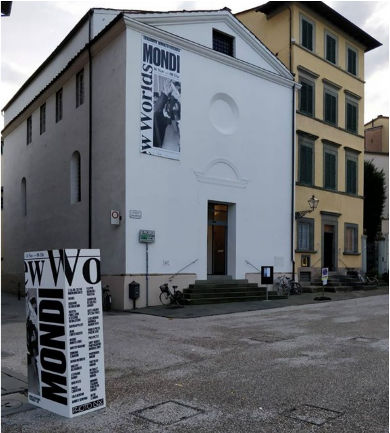
Chiesa Di San Cristoforo , Lucca, Italy