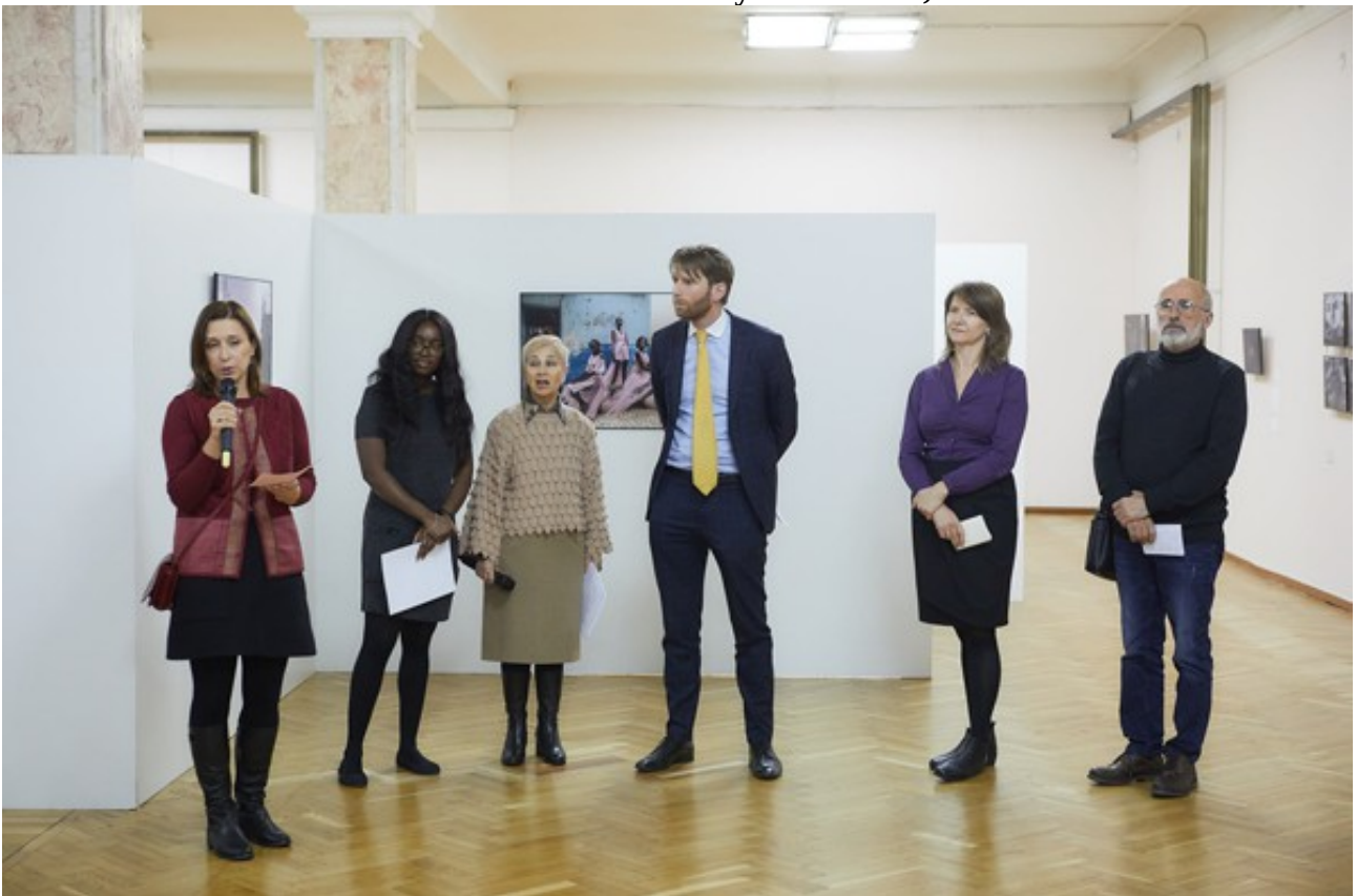
The National Museum of History of Moldova, Chisinau