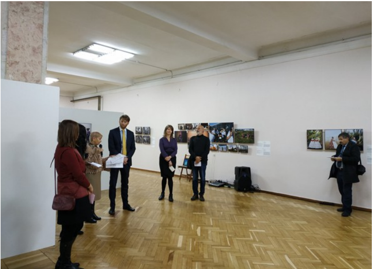
The National Museum of History of Moldova, Chisinau