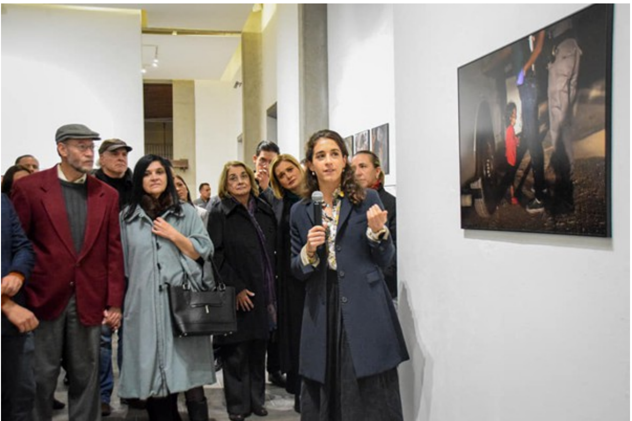
Museo Sebastian, Chihuahua, Mexico