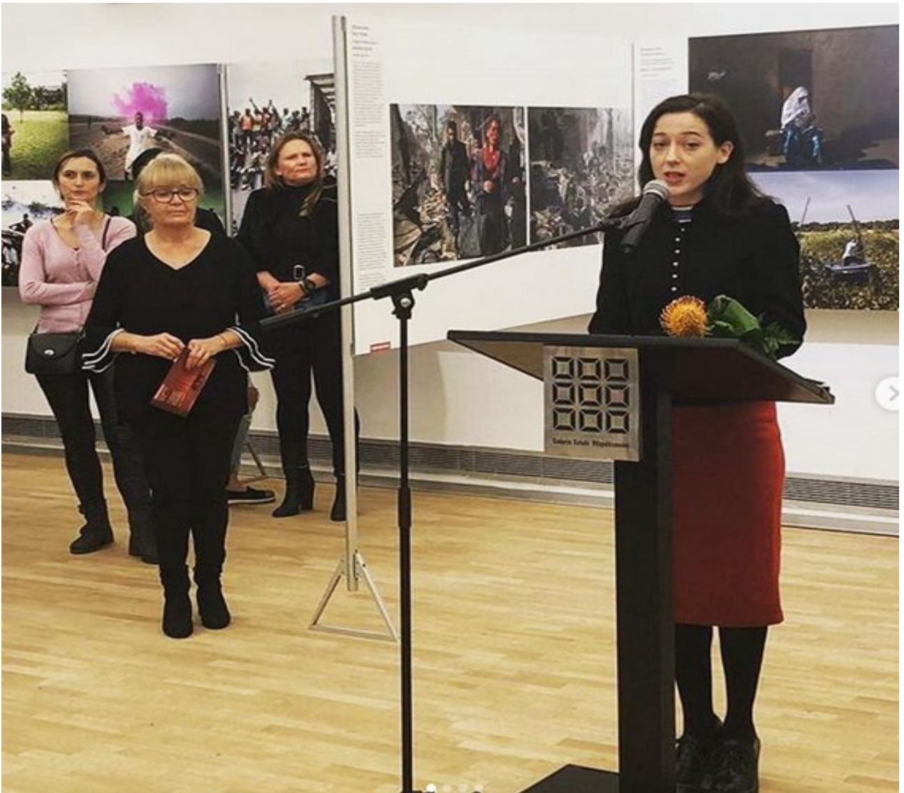
Contemporary Art Gallery , Opole, Poland