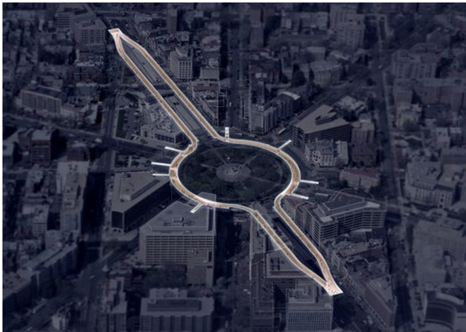
Dupont Underground, Washington DC, USA