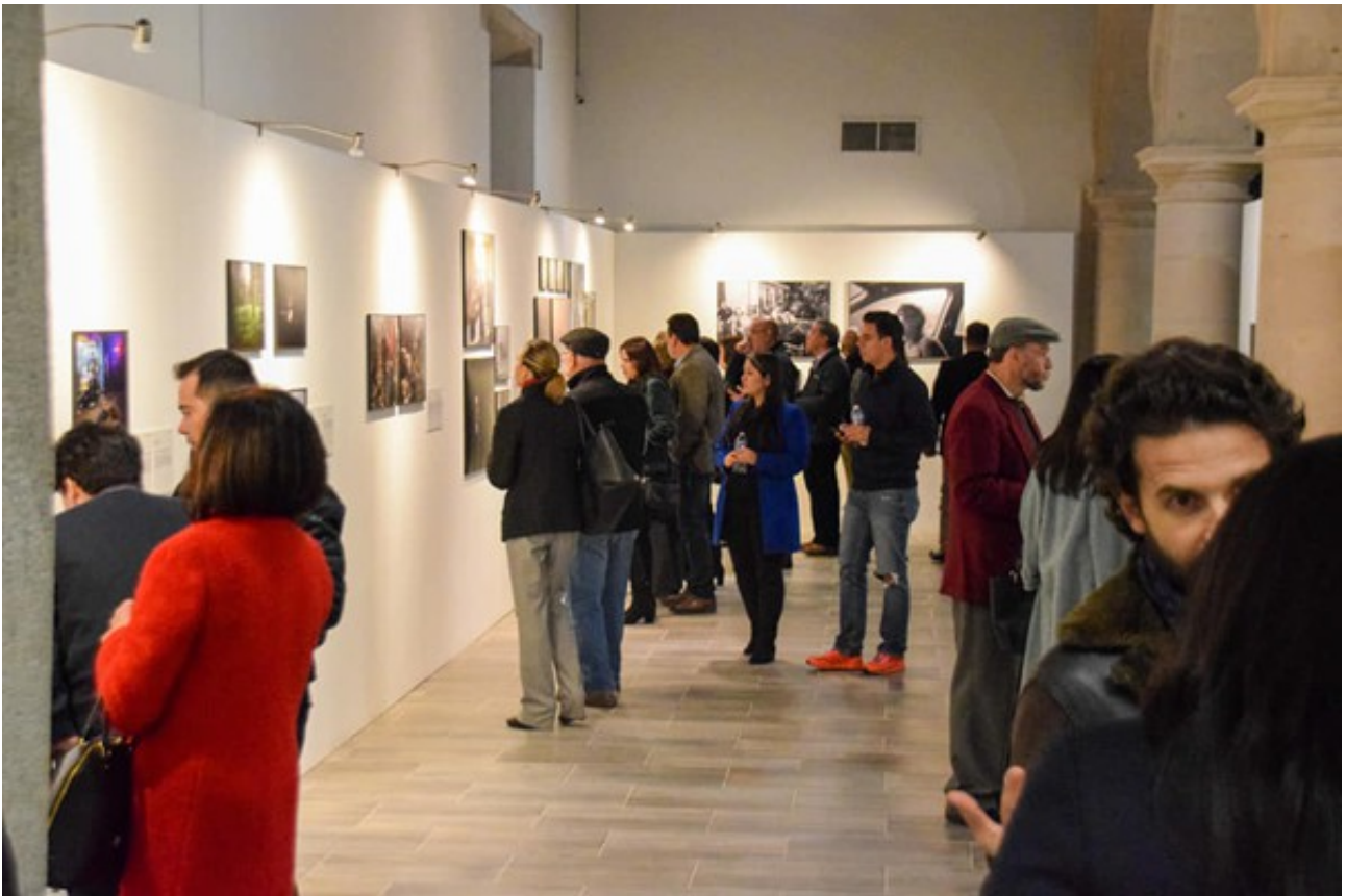
Museo Sebastian, Chihuahua, Mexico