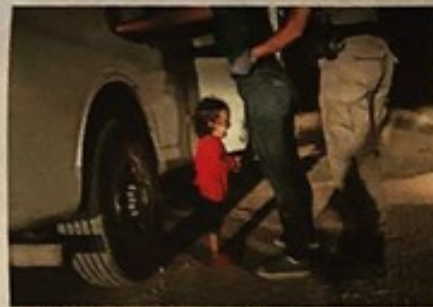
▲ De World Press Photo of the Year 2018.

Pieter ten Hoopen opent de expositie vrijdagavond en is op dezelfde avond ook te gast bij RUW, Hinthamerstraat 72-74, waar hij vertelt over zijn werk.