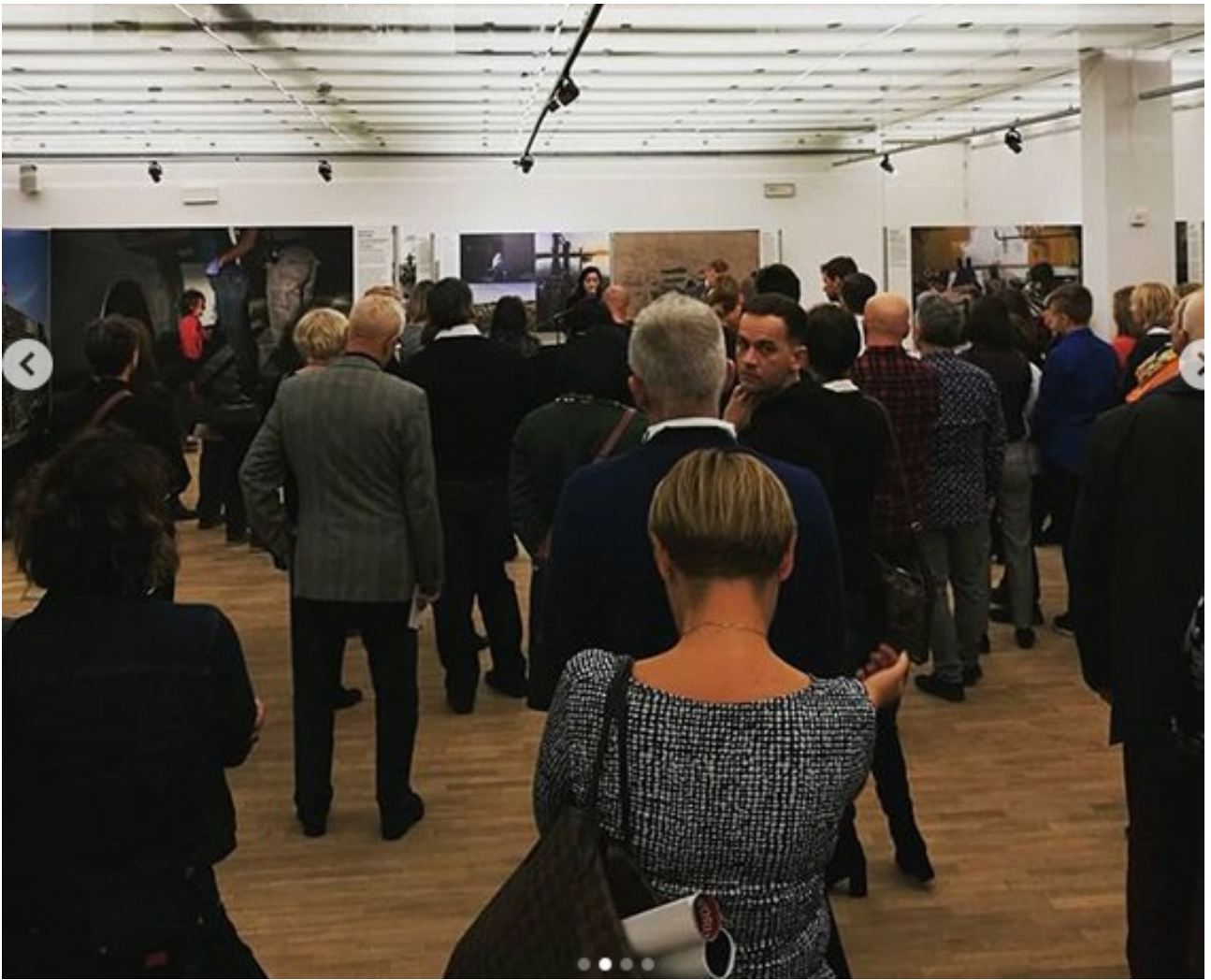
Contemporary Art Gallery , Opole, Poland