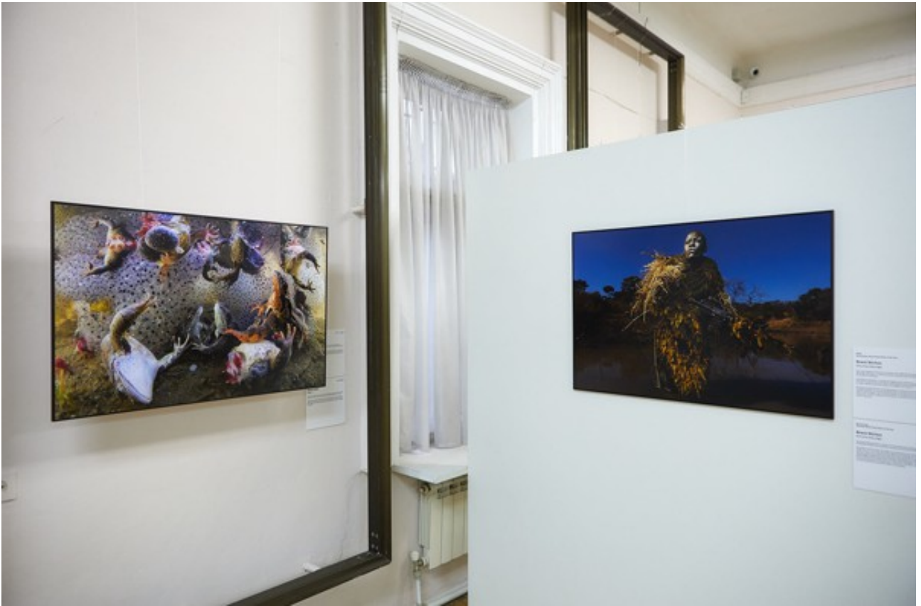
The National Museum of History of Moldova, Chisinau