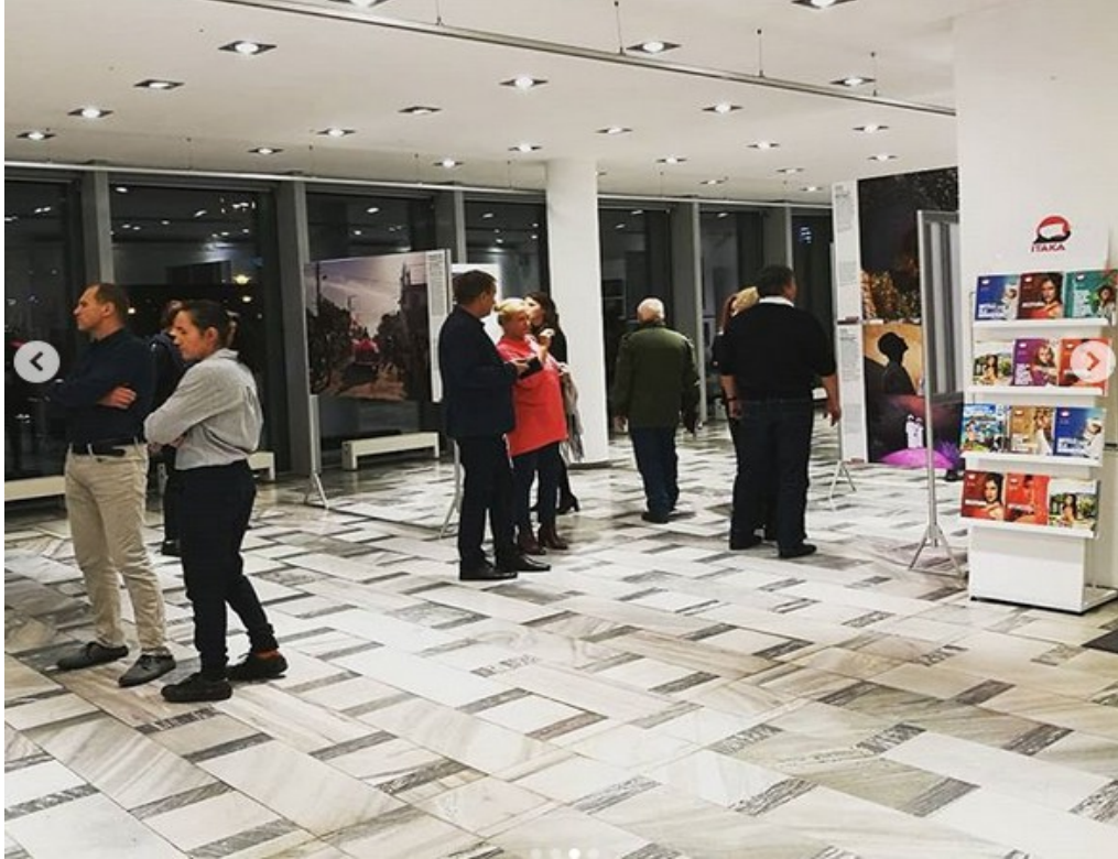
Contemporary Art Gallery , Opole, Poland