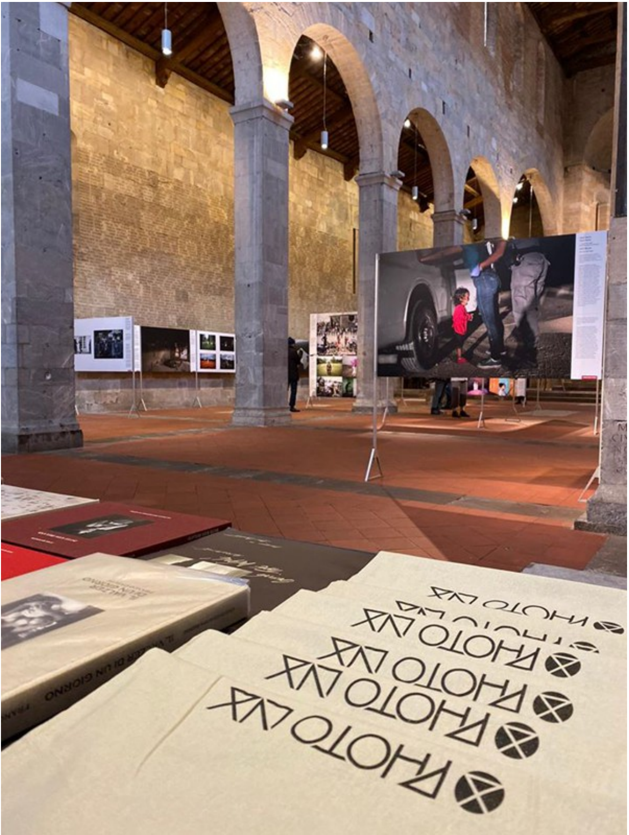
Chiesa Di San Cristoforo , Lucca, Italy