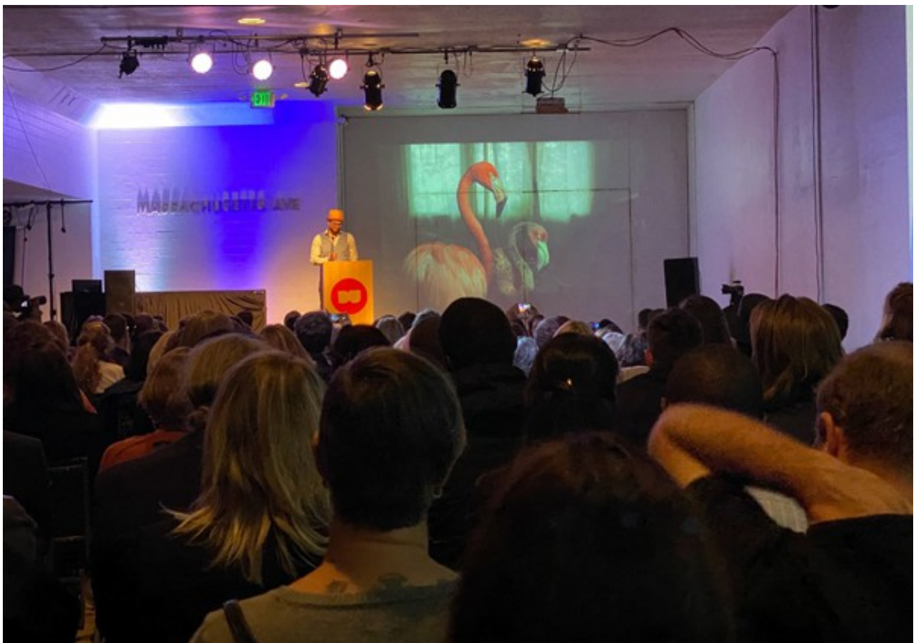
Dupont Underground, Washington DC, USA