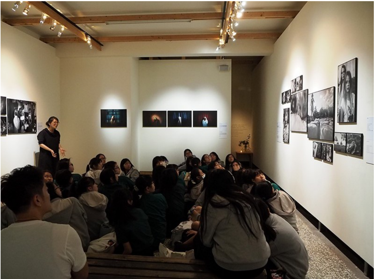
Тайланд Студия 94